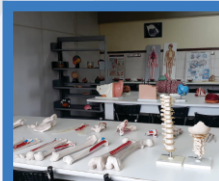
Laboratório de Anatomia