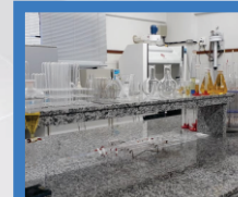
Laboratório de Química