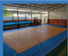
Ginásio de Esportes