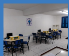
Laboratório de Robótica