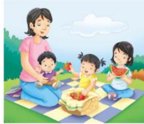
UNIT 3 MY FAMILY LESSON 11